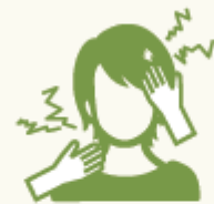
肌（額や首）がかゆい