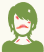
肌（顔や首）が赤くなった

下記の様な肌トラブル等が起きないように、当社商品を使用する前には必ずパッチテストをしましょう。