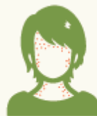
肌（額や首）にブツブツができた